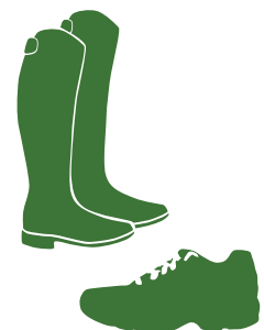
3 Boots or running shoes