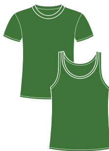
1 T-shirt or tight top